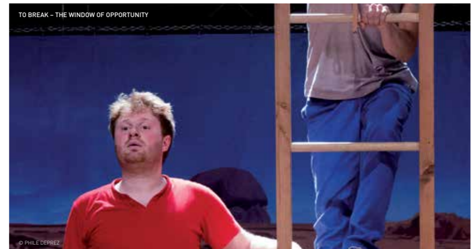
TO BREAK – THE WINDOW OF OPPORTUNITY

TO BREAK – The Window of Opportunity is een levend geworden beeldende installatie met een onvermijdelijk einde. Treed binnen in het aparte universum van Robbert&Frank/Frank&Robbert. Alles begint met een landschap. Met her en der verspreid: levenloze elementen. Tot alles kleur krijgt en de dingen op vernuftige wijze tot leven komen. In TO BREAK – The Window Of Opportunity gaat het jonge kunstenaarsduo op ambachtelijke wijze aan de slag met robuuste materialen als hout en gips, om zo een nieuwe spannende wereld te creëren. We zien een voortdurend transformerend landschap waar de ongebreidelde fantasie regeert, maar de absurditeiten niet aan geloofwaardigheid moeten inboeten. Robbert&Frank/Frank&Robbert – alchemis-